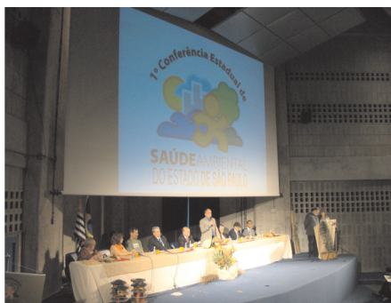
A mesa de abertura com representantes das esferas estadual, federal, do município de São Paulo e do controle social

27 e 28 de outubro de 2009 Centro de Convenções Rebouças São Paulo